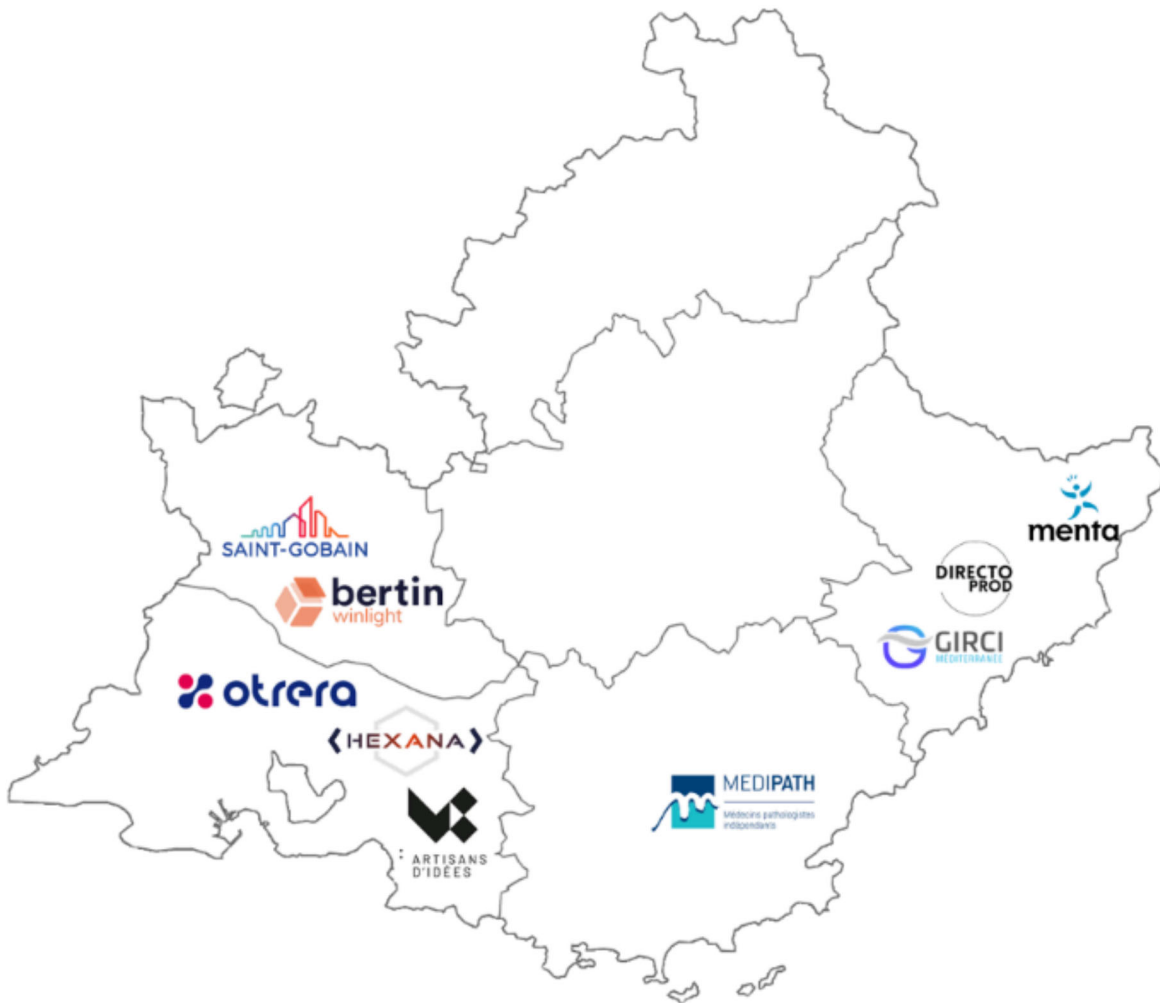
Répartition des aides engagées par département depuis le début du plan