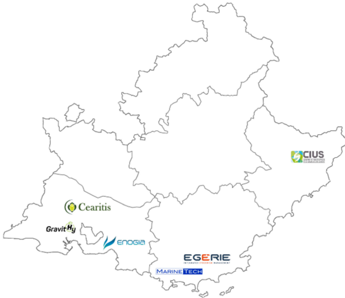
Répartition des aides engagées par département depuis le début du plan